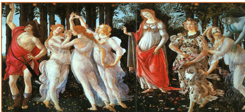
Sandro Botticelli La Primavera - Galleria degli Uffizi Firenze

concentrazione fino ai 70 euro per quello al Tacrolimus; inoltre, per la preparazione, ci vuole personale specializzato (un farmacista) e adeguate attrezzature tecniche per lo svolgimento di tutte le attività in ambiente sterile. Se teniamo conto che lo scorso anno sono stati preparati oltre 3000 flaconi, si capisce che il lavoro della Farmacia del Meyer è notevole e impegnativo. Nel 2010 l'Associazione Occhioalsole, con il contributo di 5000 euro, ha permesso l'assunzione di un collaboratore a tempo determinato da affiancare all'organico della Farmacia,